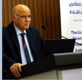
ا.د / حميد النعيمي مدير جامعة الشارقة الإمارات