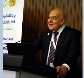
ا.د / عمرو عزت سلامة الأمين العام لاتحاد الجامعات العربية