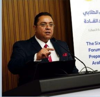
ا.د / كريم حسن همام مستشار وزير التعليم العالي ومدير معهد إعداد القادة - مصر